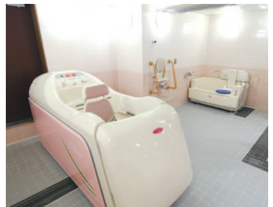
▲一階には機械浴を設置