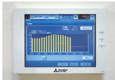
▲タンクの状態が一目でわかる 空調冷熱総合管理システムAE-200J