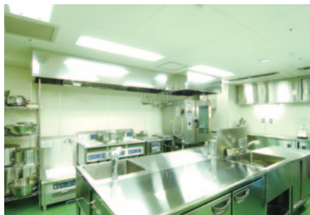
▲1日3食を全てこの厨房で調理