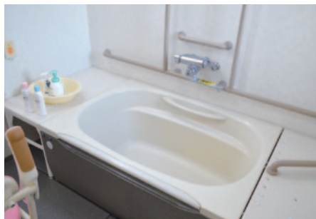
▲各フロアに設置された浴室