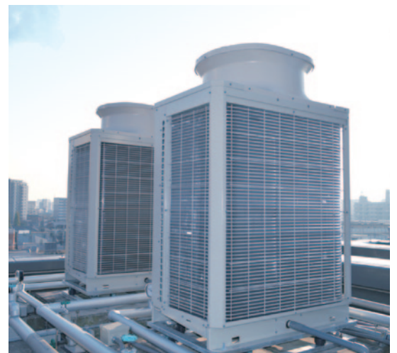
▲今回ご採用いただいた業務用エコキュート